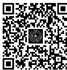
汉字星空 Sinogram Star