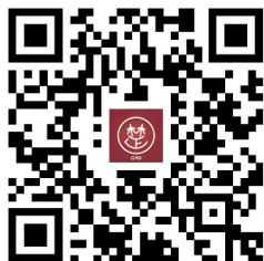
中文之钥·标准字典 Standard Dictionary